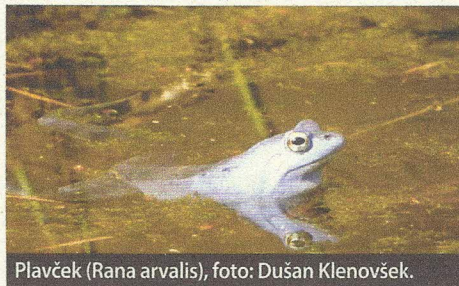
Plavček ( Rana arvalis ), foto: Dušan Klenovšek.