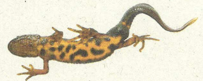
Veliki pupek, foto: Janez Tarman.